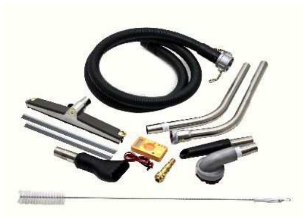
標準ツールキット